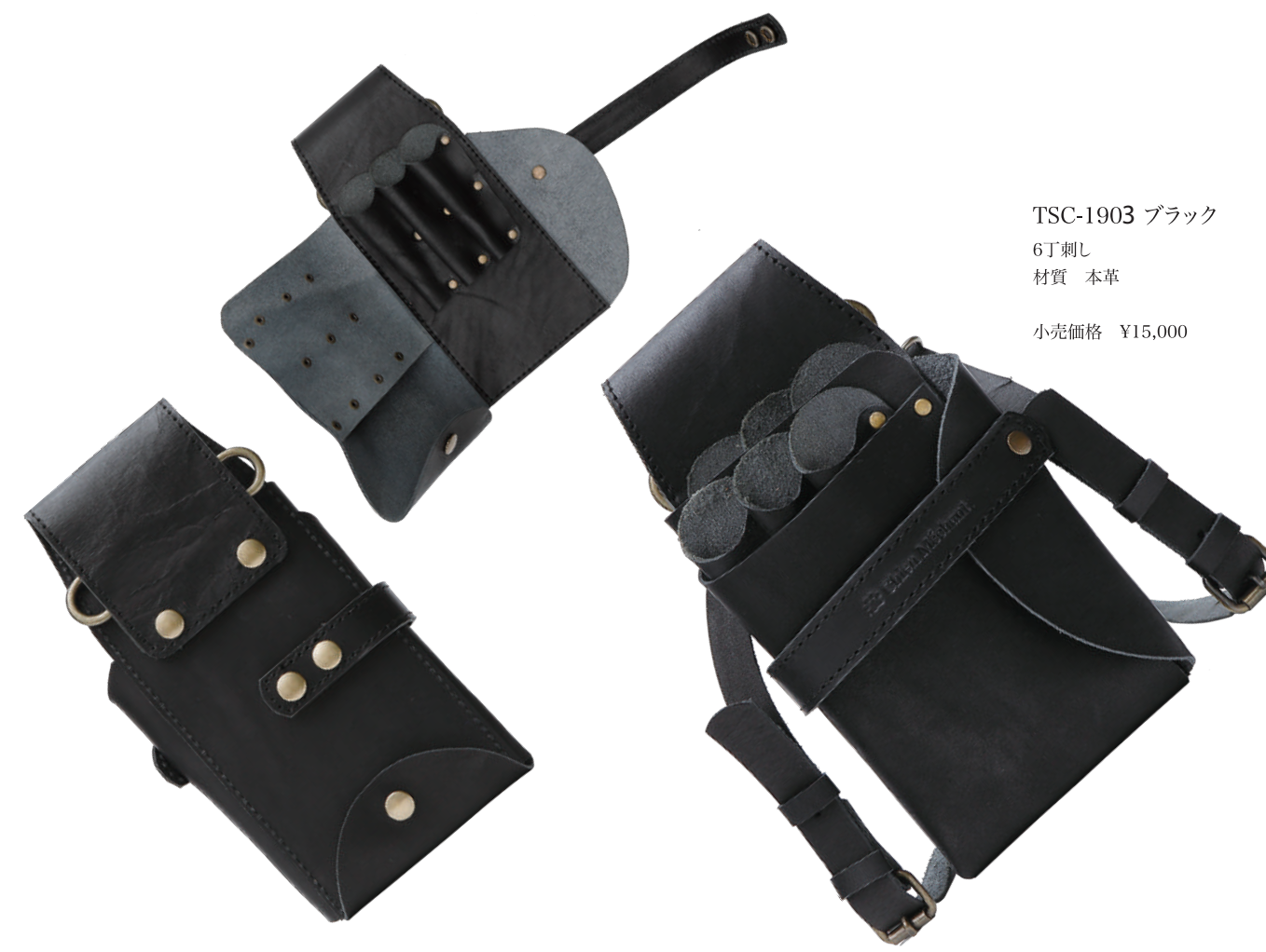
TSC-1903 ブラック 6丁刺し 材質 本革 小売価格 ¥15,000

●本カタログと実際の商品では、色合いに多少の誤差があります。●表示価格に、消費税は含まれておりません。