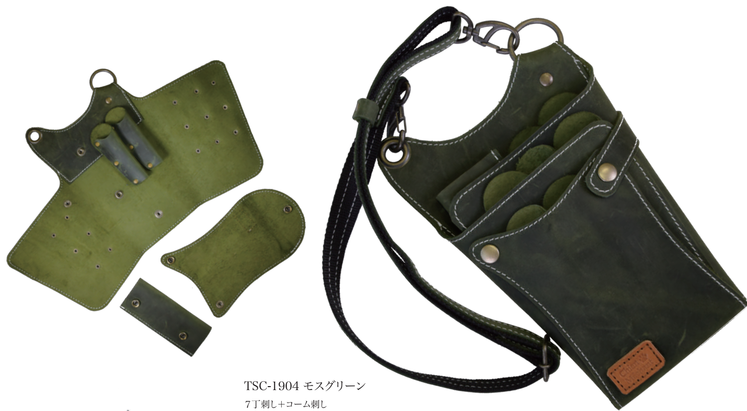
TSC-1904 モスグリーン 7丁刺し+コーム刺し 材質 本革