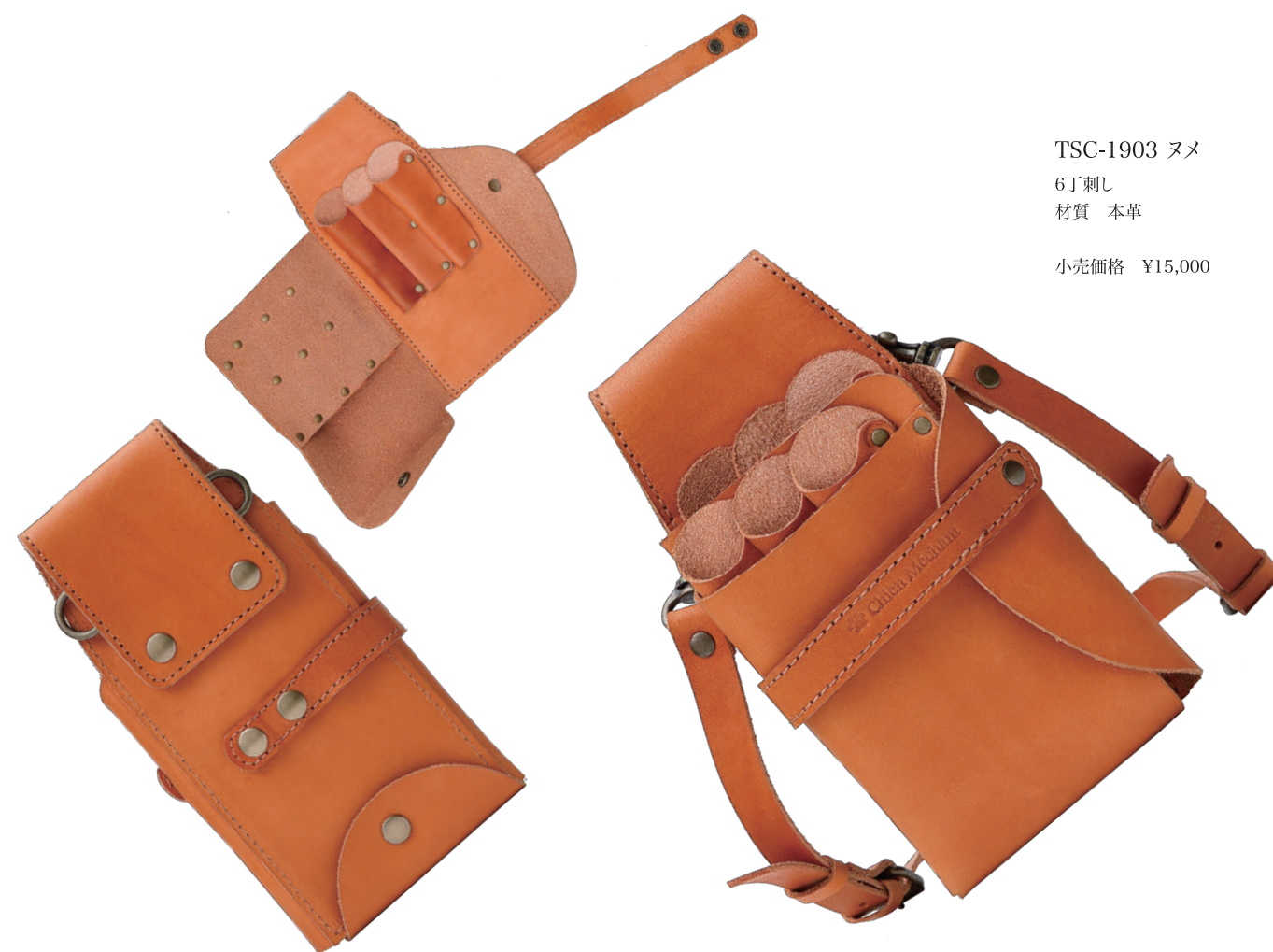
TSC-1903 ヌメ 6丁刺し 材質 本革 小売価格 ¥15,000