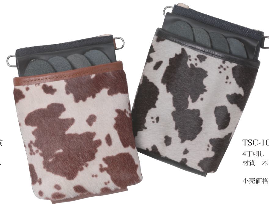
TSC-101CW 白茶 4丁刺し 材質 本革 裏 デニム