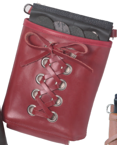
TSC-303RD レッド 4丁刺し 材質 表 本革 裏 デニム 小売価格 ¥12,000