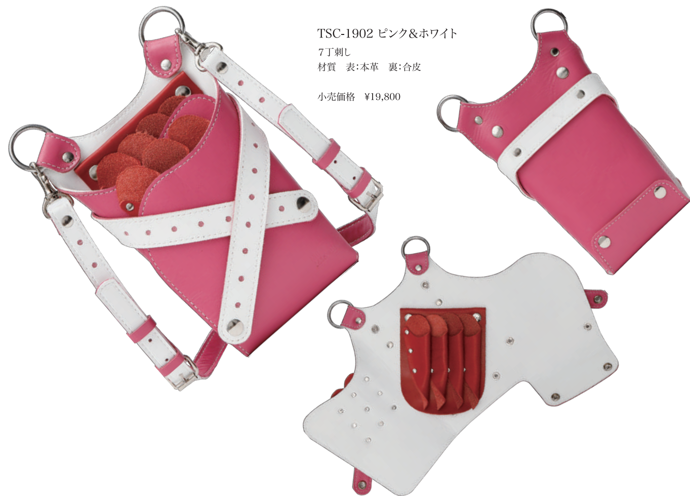
TSC-1902 ピンク&ホワイト 7丁刺し 材質 表:本革 裏:合皮