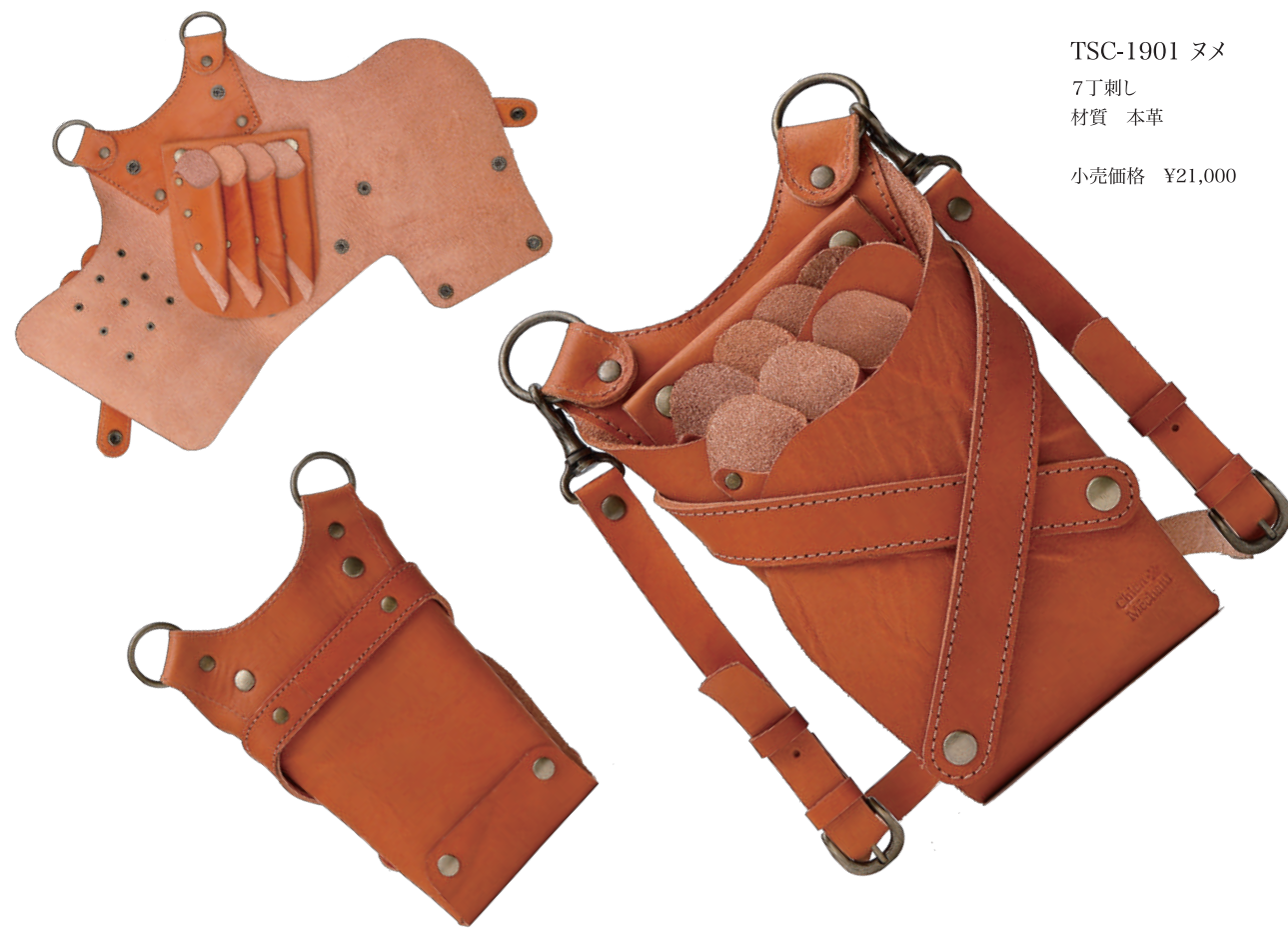
TSC-1901 ヌメ 7丁刺し 材質 本革 小売価格 ¥21,000