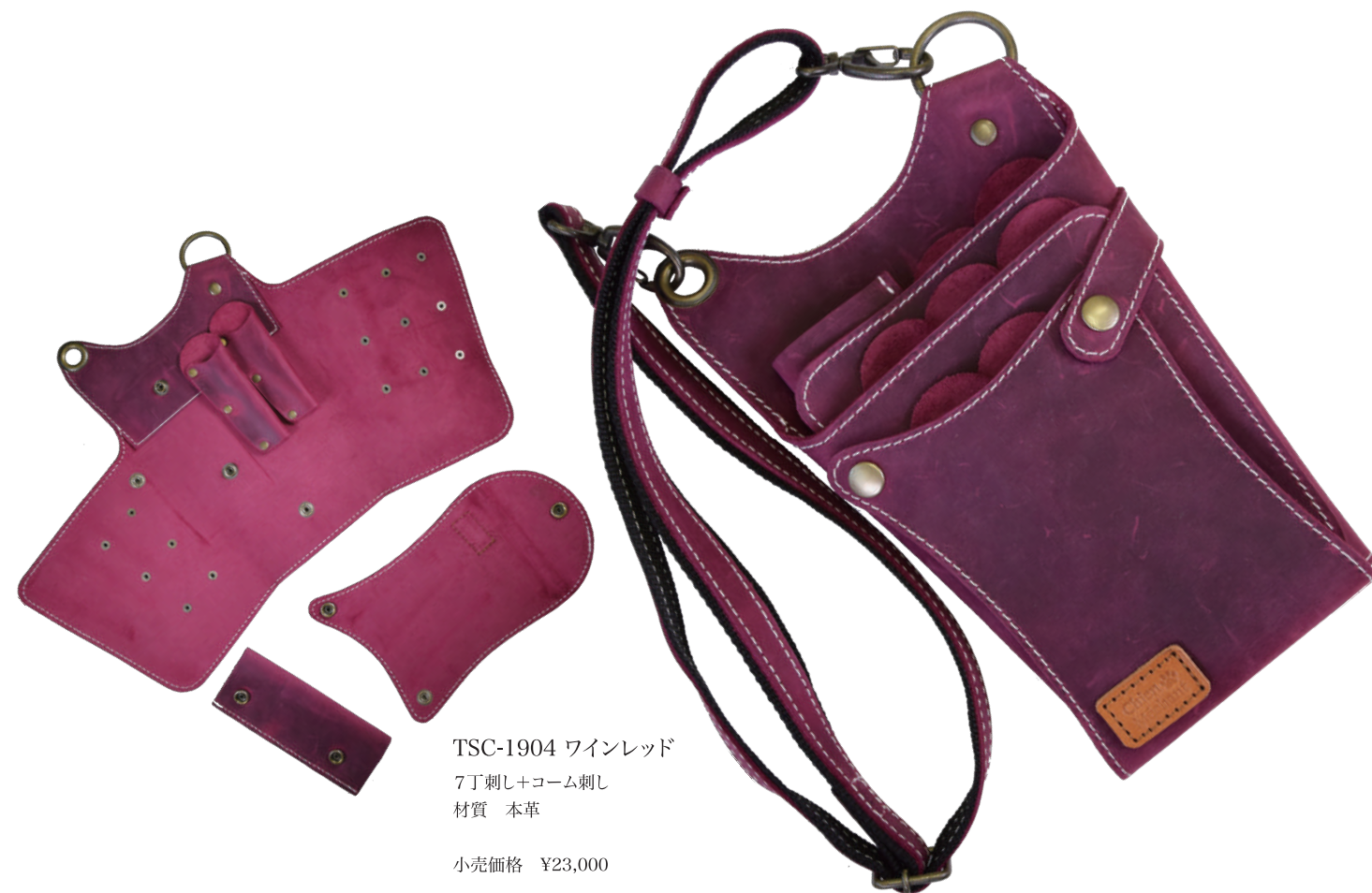
TSC-1904 ワインレッド 7丁刺し+コーム刺し 材質 本革