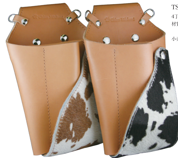
TSC-701CW 白茶 4丁刺し+コーム 材質 本革