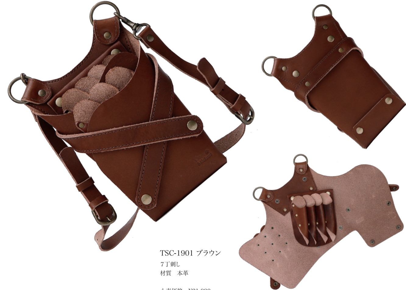
TSC-1901 ブラウン 7丁刺し 材質 本革 小売価格 ¥21,000

●本カタログと実際の商品では、色合いに多少の誤差があります。●表示価格に、消費税は含まれておりません。