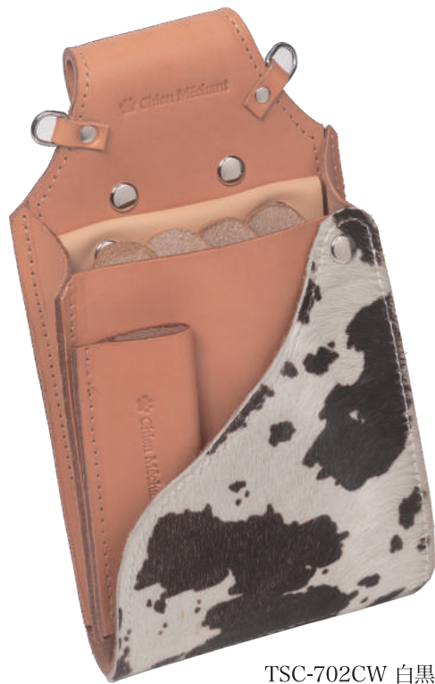
TSC-702CW 白黒 4丁刺し+コーム 材質 本革