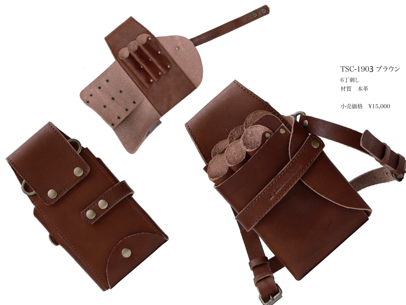
TSC-1903 ブラウン 6丁刺し 材質 本革 小売価格 ¥15,000