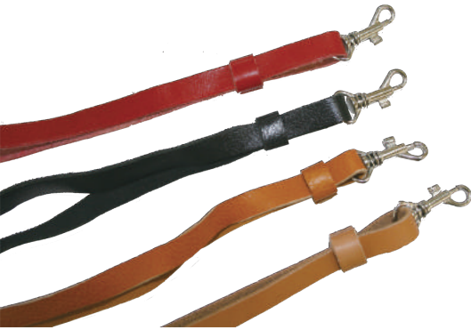
交換用革ひも フリーサイズ ¥3,500

●本カタログと実際の商品では、色合いに多少の誤差があります。●表示価格に、消費税は含まれておりません。