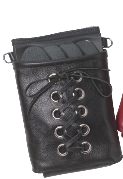
TSC-304B ブラック 4丁刺し 材質 表 本革 裏 デニム 小売価格 ¥12,000