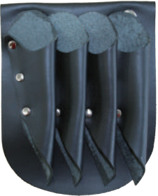
交換用革ホルダー カラー：ブラック ヌメ ¥3,500