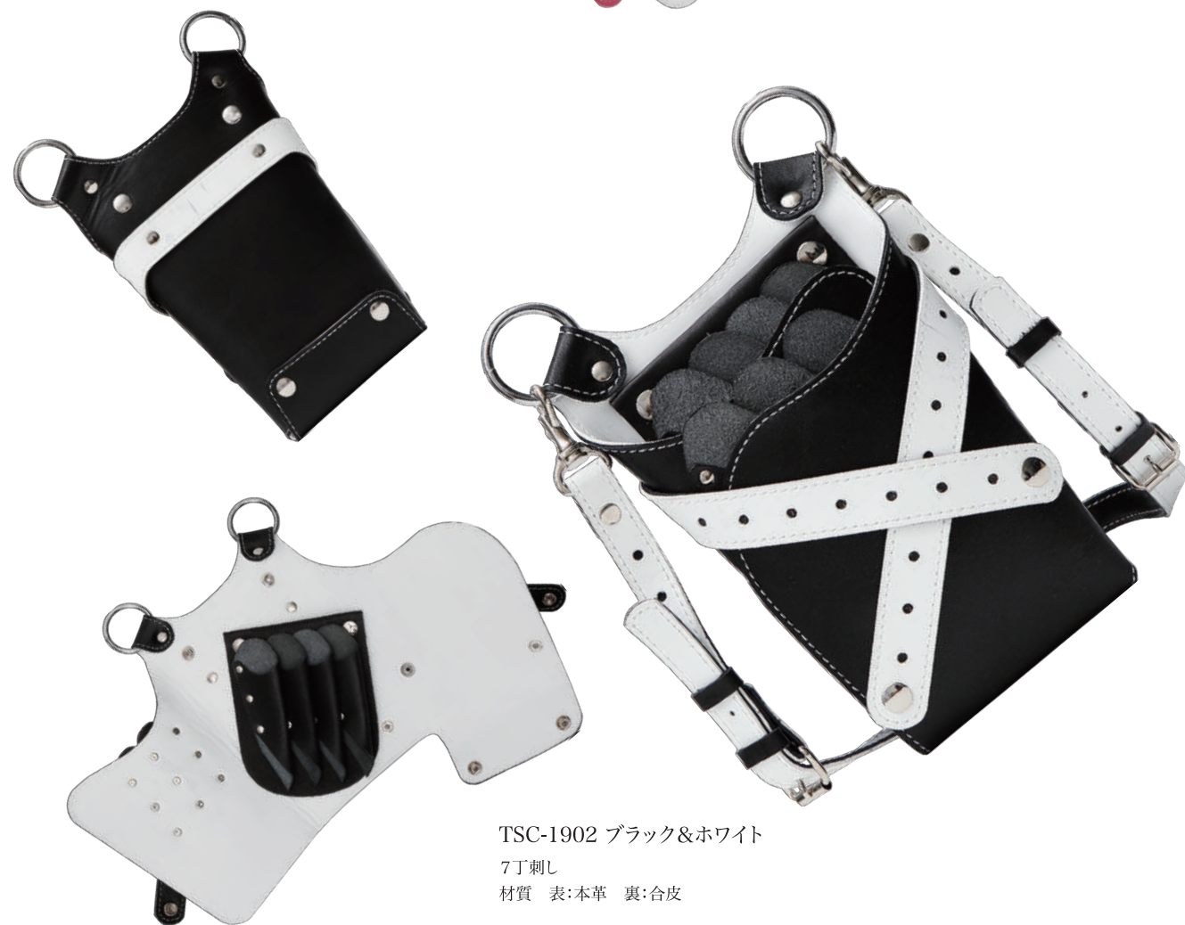
TSC-1902 ブラック&ホワイト 7丁刺し 材質 表:本革 裏:合皮