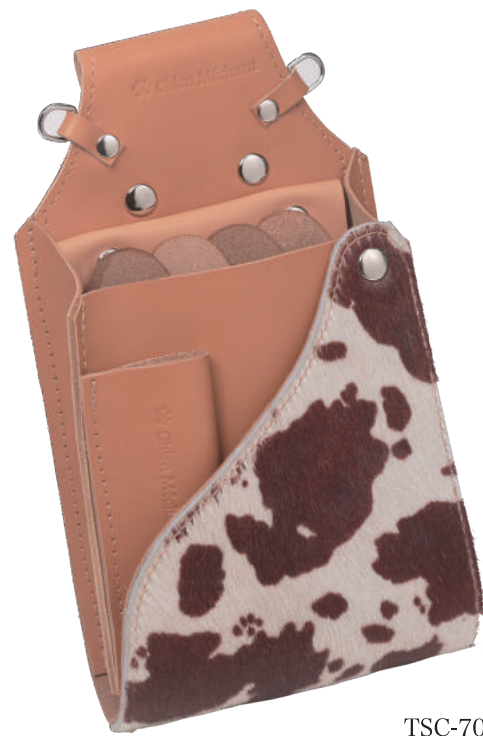
TSC-702CW 白茶 4丁刺し+コーム 材質 本革