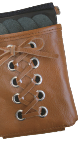
TSC-301Y イエロー 4丁刺し 材質 表 本革 裏 デニム 小売価格 ¥12,000