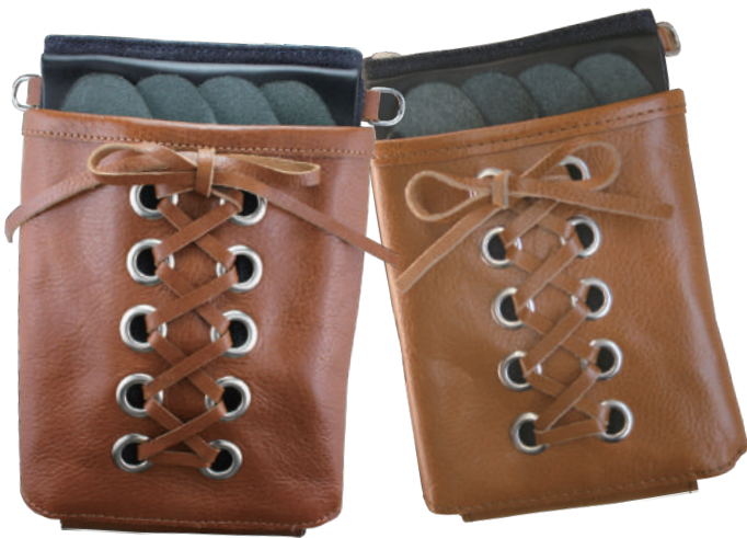
TSC-302CM キャメル 4丁刺し 材質 表 本革 裏 デニム 小売価格 ¥12,000