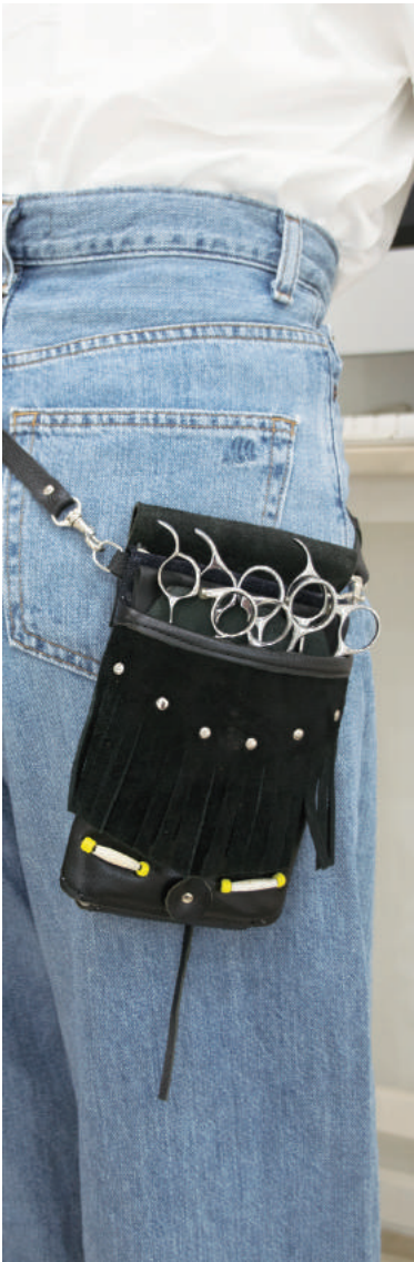
TSC-404B (ブラック) 4丁刺し 材質 表 本革 裏 デニム 小売価格 ¥12,000