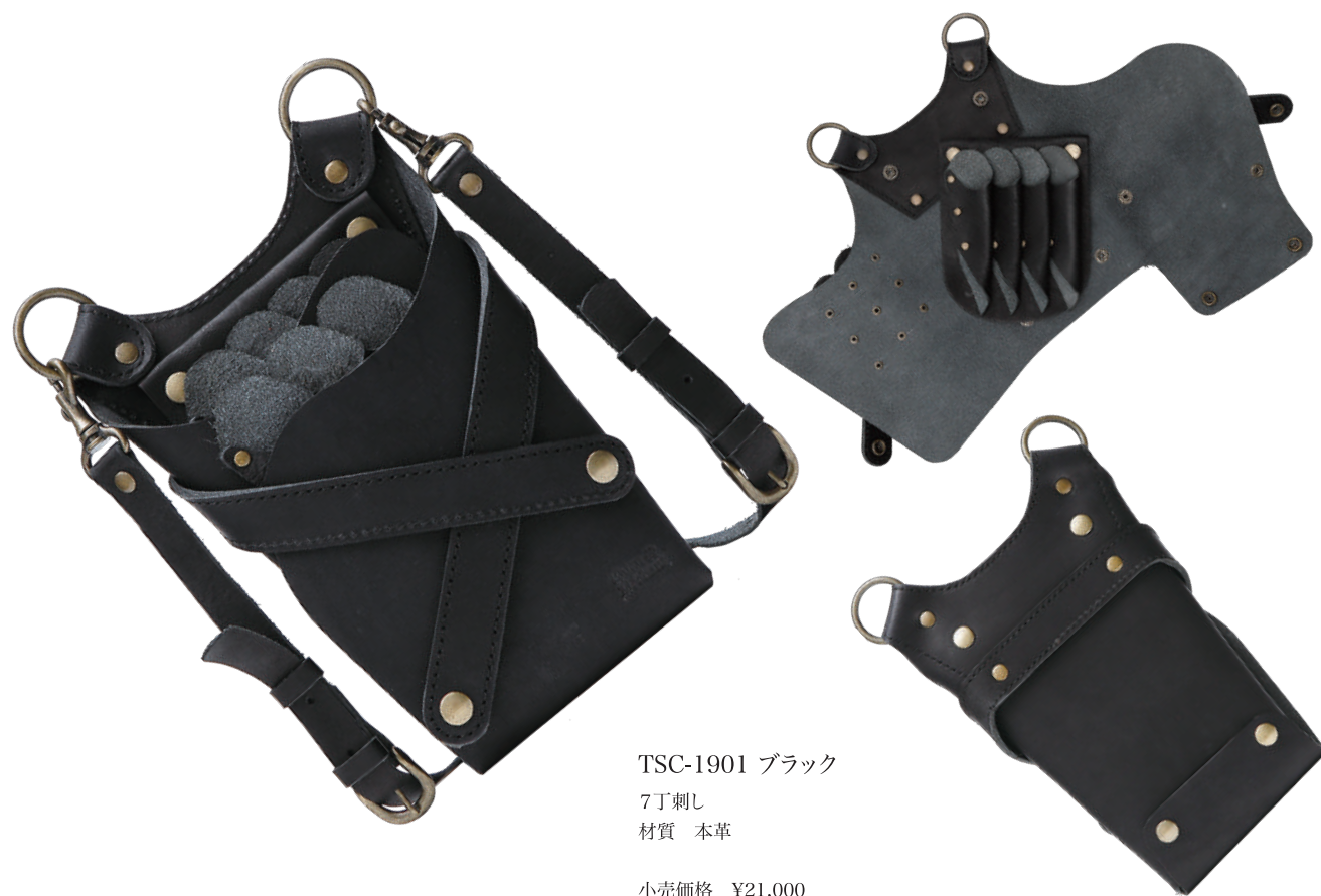
TSC-1901 ブラック 7丁刺し 材質 本革 小売価格 ¥21,000