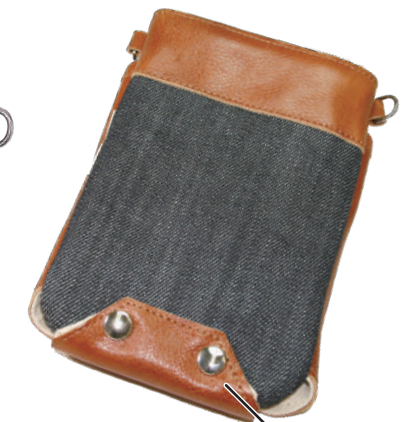
TSC-101CW 白黒 4丁刺し 材質 本革 裏 デニム