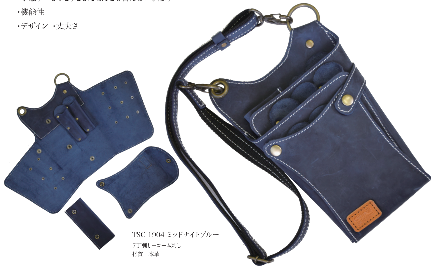
TSC-1904 ミッドナイトブルー 7丁刺し+コーム刺し 材質 本革